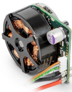
Il nuovo ECX FLAT 32 con elettronica integrata.